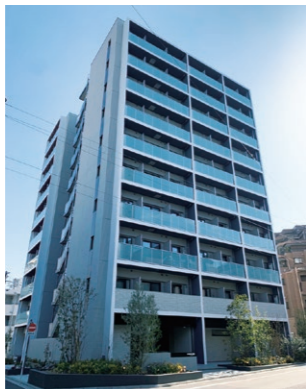
パウスクロス北新宿

コミュニケーションを促進する共用部を充実させた中央日本土地建物株式会社様の食事付き学生レジデンスブランド「BAUS CROSS」第1弾として運用を開始しました。既存物件も順次リブランディング予定です。3段階セキュリティを共通設備とし、ノンタッチカードキーも採用。女性専用フロアもあり、すべての学生が安心できる学生レジデンスです。「パウスクロス相模大野」も同時期に竣工しました。