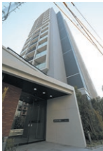
パウスクロス相模大野

JR総武線・都営大江戸線「東中野」駅 徒歩9分 / 東京メトロ東西線「落合」駅 徒歩9分 / JR山手線・東京メトロ東西線「高田馬場」駅 徒歩15分 鉄筋コンクリート造 10F 全138室 2022年2月 竣工 事業主：中央日本土地建物株式会社様 三信住建株式会社様