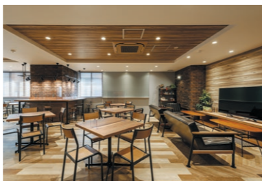
リビオセゾン亀有

学生マンションブランド「LIVIO Saison」シリーズの第1号物件です。人生の中で最も輝く限られた時期（Saison：フランス語）を、四季（Saison：フランス語）が移ろうように彩ってほしいという願いが込められています。1階には広い共用ラウンジと、トリプルセキュリティの安心感。そして専有部の家具はアパレルメーカー「nico and...」監修です。同時竣工の第2号物件「リビオセゾン笹塚」も供用開始しています。