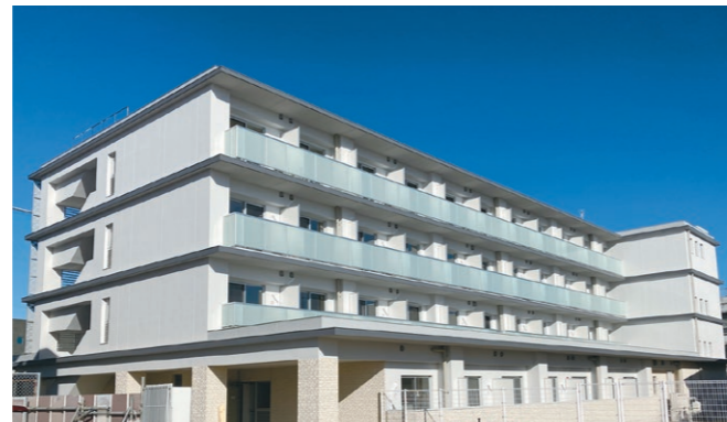
「福岡大学体育寮」(福岡) 福岡大学

キャンパス内 鉄筋コンクリート造 5F 2021年10月 男子棟 竣工 / 2023年2月 女子棟 竣工予定