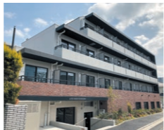
リビオセゾン笹塚

JR常磐線「亀有」駅 徒歩11分 / 東京メトロ千代田線「綾瀬」駅 徒歩17分 鉄筋コンクリート造 7F / 全98室 2022年2月 竣工 事業主：日鉄興和不動産株式会社様