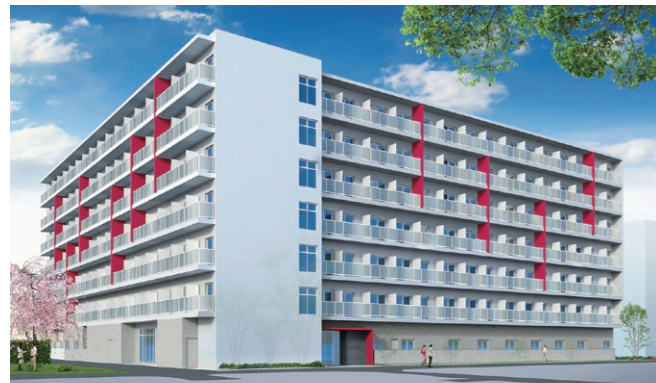
「お茶の水女子大学 音羽館」(東京) お茶の水女子大学